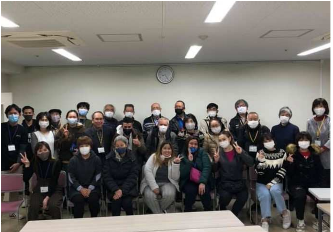
すいようきょうしつ がつきさいしゅうび きねんきつえい 水曜教室2学期最終日の記念撮影

日本はこれから本格的な冬に入ります。受講生の中には日本で初めての冬を迎える人もいません。また、2回目3回目の冬だとしても、母国と比べるとずいぶん寒く、つらい思いをする人も多いのではないかと思います。どうか健康には十分注意し、元気に新年を迎えてください。